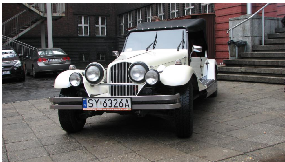
Samochód Wykonany przez naszych uczniów: Nestor – kopia Alfę Romeo z 1937r.

Serdecznie zapraszamy! Zdobędziesz zawód, otrzymasz kwalifikacje potwierdzone na rynek światowy przez anglojęzyczny dokument: Europass; możesz zdawać egzamin maturalny po technikum i kształcić się dalej. Na Politechnice Śląskiej (z którą to „mechanik” ma umowę o współpracy) lub wybrać dowolny inny kierunek studiów. Ale ze zdobytym zawodem i umiejętnościami już w kieszeni... Powodzenia!